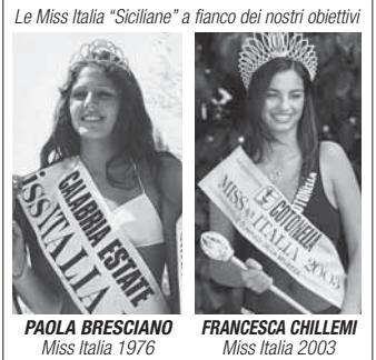
Le Miss Italia "Siciliane" a fianco dei nostri obiettivi

N.B. Causa spazio ridotto, l'elenco completo di tutti i collaboratori, che ringraziamo sempre, è riportato nel pieghevole a colori dell'Associazione.