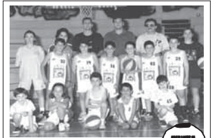
IL CENTRO MINIBASKET ORLANDINO porta sulle maglie l'effigie dell'ASL.