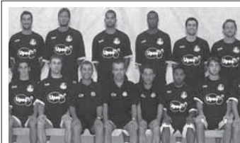
I giocatori dell'ORLANDINA BASKET sono diventati potenziali donatori di midollo osseo.