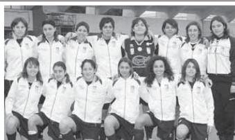
Le calciatrici dell'ORLANDIA '97 Testimonial della donazione del cordone ombelicale.