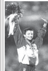
La campionessa del mondo ANNA RITA SIDOTI è con noi, per Loro.