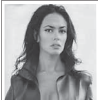
L'attrice MARIAGRAZIA CUCINOTTA ci sostiene nel nostro obiettivo.