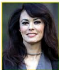
L'attrice Mariagrazia Cucinotta ci sostiene nel nostro obiettivo.