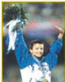
La campionessa del mondo ANNA RITA SIDOTI è con noi per loro.