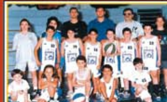
II CENTRO MINIBASKET ORLANDINO porta sulla maglia l'effigie dell'ASL.