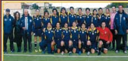
Le calciatrici dell'ORLANDIA '97 di serie A2, testimonial della donazione del cordone ombelicale