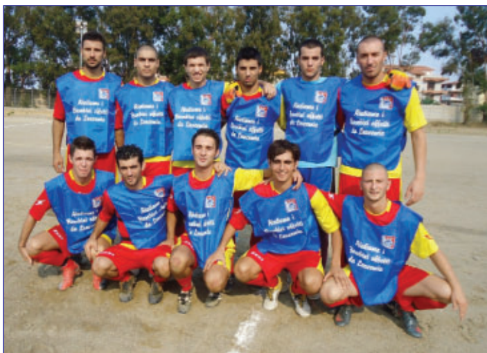
I calciatori della Ciappazzi portano nelle maglie di gara il logo della nostra Associazione. Nella foto una formazione con le casacche di riscaldamento pre-partita.