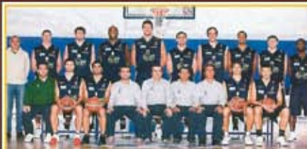
I giocatori dell'UPEA ORLANDINA BASKET di Serie A1 hanno contribuito nella campagna per la donazione del midollo osseo.