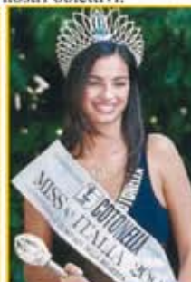
FRANCESCA CHILLEMI Miss Italia 2003