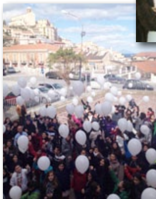
a Patti (ME) all'Istituto Comprensivo

Il 25 Luglio 2015 L' Associazione Giovanile "A Cumbriccu-la" col patrocinio del Comune di Oliveri, in collaborazione con l'Associazione Onlus Siciliana per la lotta contro le Leucemie e con il testimonial Massimo Modica, hanno organizzato la