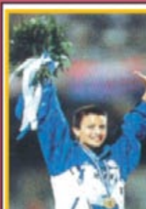
La campionessa del mondo di marcia ANNARITA SIDOTI continua ad essere con noi per loro