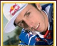
TONY CAIROLI Campione del mondo di motocross