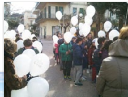
A Capo d'Orlando (ME) con gli alunni della scuola elementare del centro.