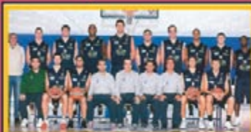
I giocatori dell' UPEA ORLANDINA BASKET di Serie A1 hanno contribuito nella campagna per la donazione del midollo osseo