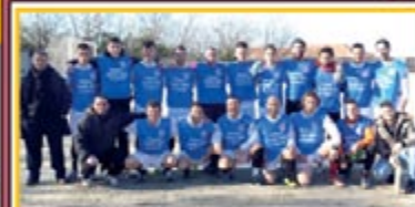
I giocatori della POLISPORTIVA UMBERTINA porteranno sulle maglie il logo dell'ASL