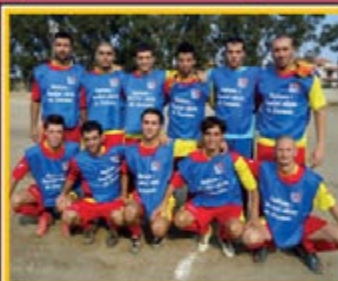
LA CIAPPAZZI CALCIO porta sulle maglie il logo dell'ASL