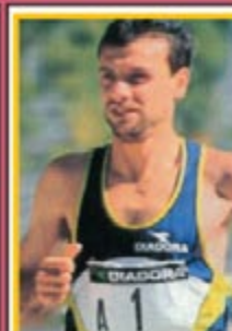
Il campione di maratona VINCENZO MODICA ci aiuta nella nostra lotta

Le MISS ITALIA SICILIANE a fianco dei nostri obiettivi