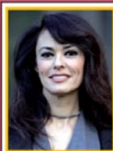
L'attrice MARIAGRAZIA CUCINOTTA ci sostiene nel nostro obiettivo