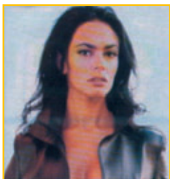
L'attrice Mariagrazia Cucinotta ci sostiene nel nostro obiettivo.