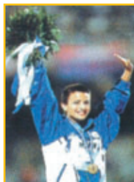
La campionessa del mondo ANNA RITA SIDOTI è con noi per loro.