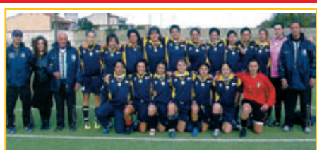
Le calciatrici dell' ORLANDIA '97 di serie A2, testimonial della donazione del cordone ombelicale