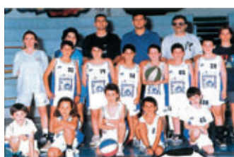
IL CENTRO MINIBASKET ORLANDINO porta sulla maglia l'effigie dell'ASL.