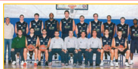
I giocatori dell' UPEA ORLANDINA BASKET di Serie A1 hanno contribuito nella campagna per la donazione del midollo osseo.