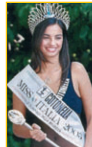
FRANCESCA CHILLEMI Miss Italia 2003