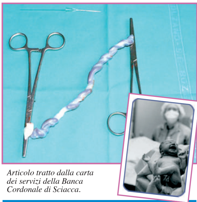
Articolo tratto dalla carta dei servizi della Banca Cordonale di Sciacca.

Grazie alla nostra associazione la raccolta del sangue del cordone ombelicale è stata attivata negli ospedali di Barcellona P.G., Milazzo, Mistretta, Patti e S. Agata M.ilo.