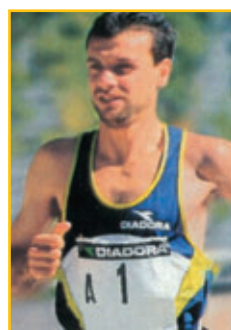
Il campione di maratona VINCENZO MODICA ci aiuta nella nostra lotta