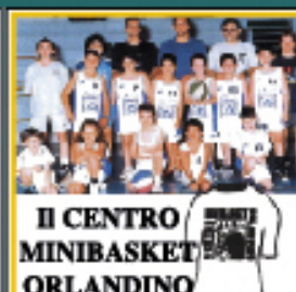
IL CENTRO MINIBASKET ORLANDINO