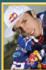
TONY CAIROLI Campione del mondo di motocross