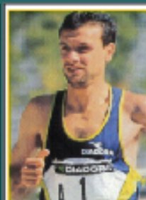
Il campione di maratona VINCENZO MODICA ci aiuta nella nostra lotta