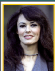
L'attrice MARIAGRAZIA CUCINOTTA ci sostiene nel nostro obiettivo