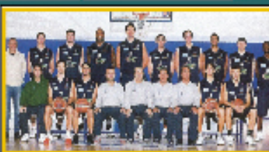
I giocatori dell' UPEA ORLANDINA BASKET di Serie A1 hanno contribuito nella campagna per la donazione del midollo osseo