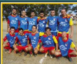
LA CIAPPAZZI CALCIO porta sulla maglia il logo dell'ASL