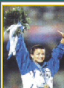
La campionessa del mondo di marcia ANNARITA SIDOTI è con noi per loro