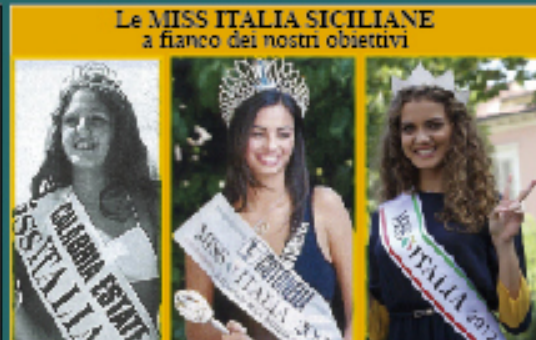
Le MISS ITALIA SICILIANE a fianco dei nostri obiettivi