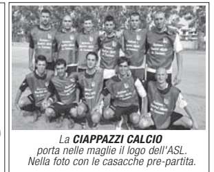
La CIAPPAZZI CALCIO porta nelle maglie il logo dell'ASL. Nella foto con le casacche pre-partita.