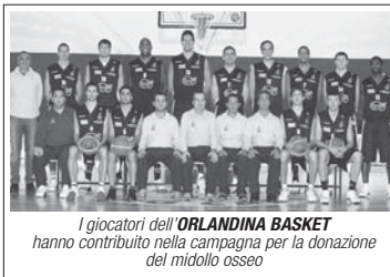
I giocatori dell' ORLANDINA BASKET hanno contribuito nella campagna per la donazione del midollo osseo