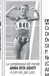
La campionessa del mondo ANNA RITA SIDOTI è con noi, per Loro.