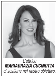
L'attrice MARIAGRAZIA CUCINOTTA ci sostiene nel nostro obiettivo.