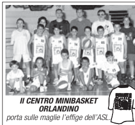
IL CENTRO MINIBASKET ORLANDINO porta sulle maglie l'effigie dell'ASL