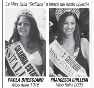
Le Miss Italia "Siciliane" a fianco dei nostri obiettivi PAOLA BRESCIANO Miss Italia 1976 FRANCESCA CHILLEMI Miss Italia 2003