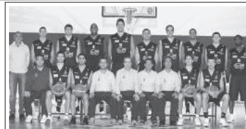
I giocatori dell' ORLANDINA BASKET hanno contribuito nella campagna per la donazione del midollo osseo