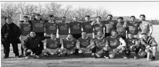
I giocatori della POLISPORTIVA UMBERTINA porteranno nelle maglie il logo dell'ASL. Nella foto con le casacche pre-partita.