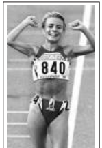
La campionessa del mondo ANNA RITA SIDOTI continua ad essere con Noi per Loro