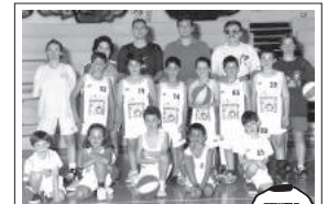
IL CENTRO MINIBASKET ORLANDINA YOUNG porta sulle maglie l'effigie dell'ASL.