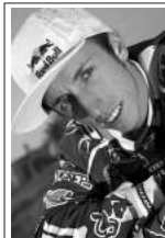
Il 7 volte campione del mondo di motocross TONY CAIROLI vola pure per noi