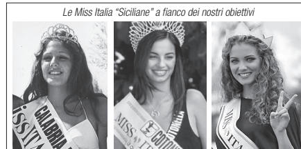
Le Miss Italia "Siciliane" a fianco dei nostri obiettivi