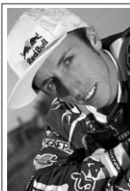
Il 7 volte campione del mondo di motocross TONY CAIROLI vola pure per noi