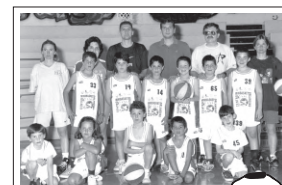
IL CENTRO MINIBASKET ORLANDINA YOUNG porta sulle maglie l'effigie dell'ASL.