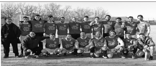
I giocatori della POLISPORTIVA UMBERTINA porteranno nelle maglie il logo dell'ASL. Nella foto con le casacche pre-partita.