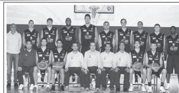
I giocatori dell' ORLANDINA BASKET hanno contribuito nella campagna per la donazione del midollo osseo